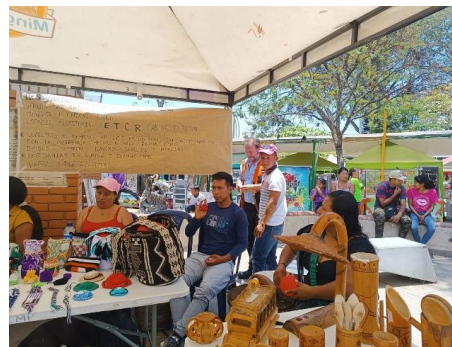
Feria saberes y sabores en Miranda - Cauca - Fotografía Amanda Anacona