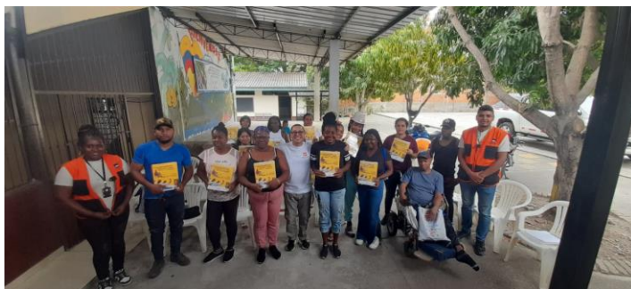
Entrega de módulos Modelo Etnoeducativo a 63 estudiantes de los ciclo V y VI

Modelo Educativo Flexible “Modelo Etnoeducativo para comunidades negras del Pacífico Colombiano”.