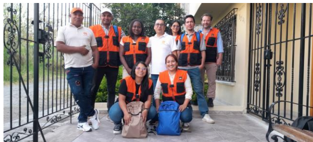
Formación docente y entrega de 7 kits.