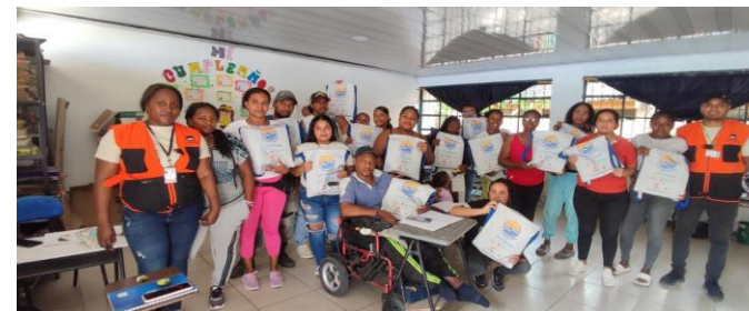
Entrega de Kits escolares a 113 estudiantes