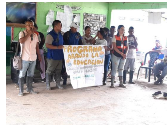
Minga de sabes- visita al Naya Buenos Aires

Modelo Educativo Flexible “Modelo Etnoeducativo para comunidades negras del Pacífico Colombiano”.